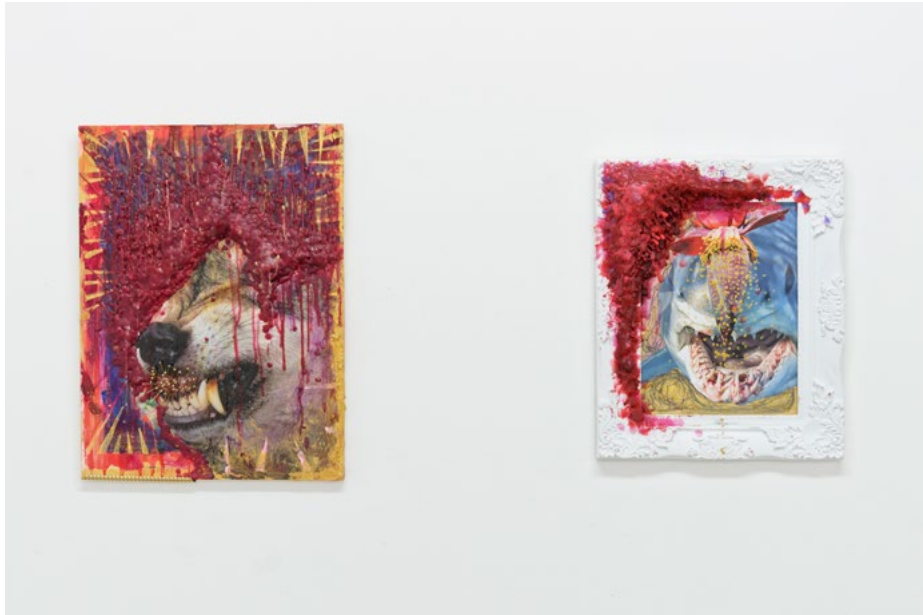
Vue de l'exposition Past Increasing de Jan R. Faust, à L'Assaut de la menuiserie