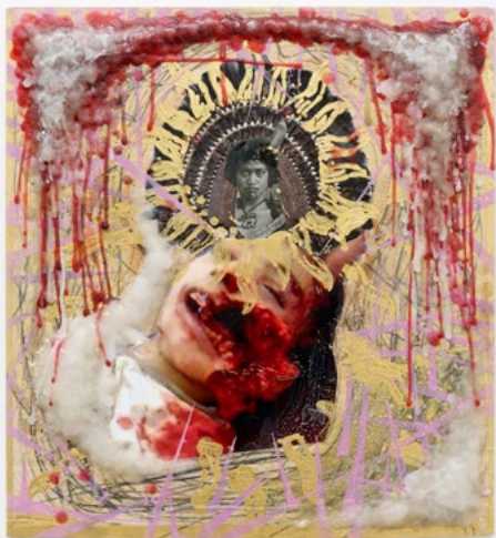
Sans titre , 2024, technique mixte sur bois, 38 × 35 cm