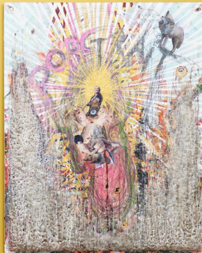
Portrait , 2022-2024, technique mixte sur bois, 100 × 80 cm