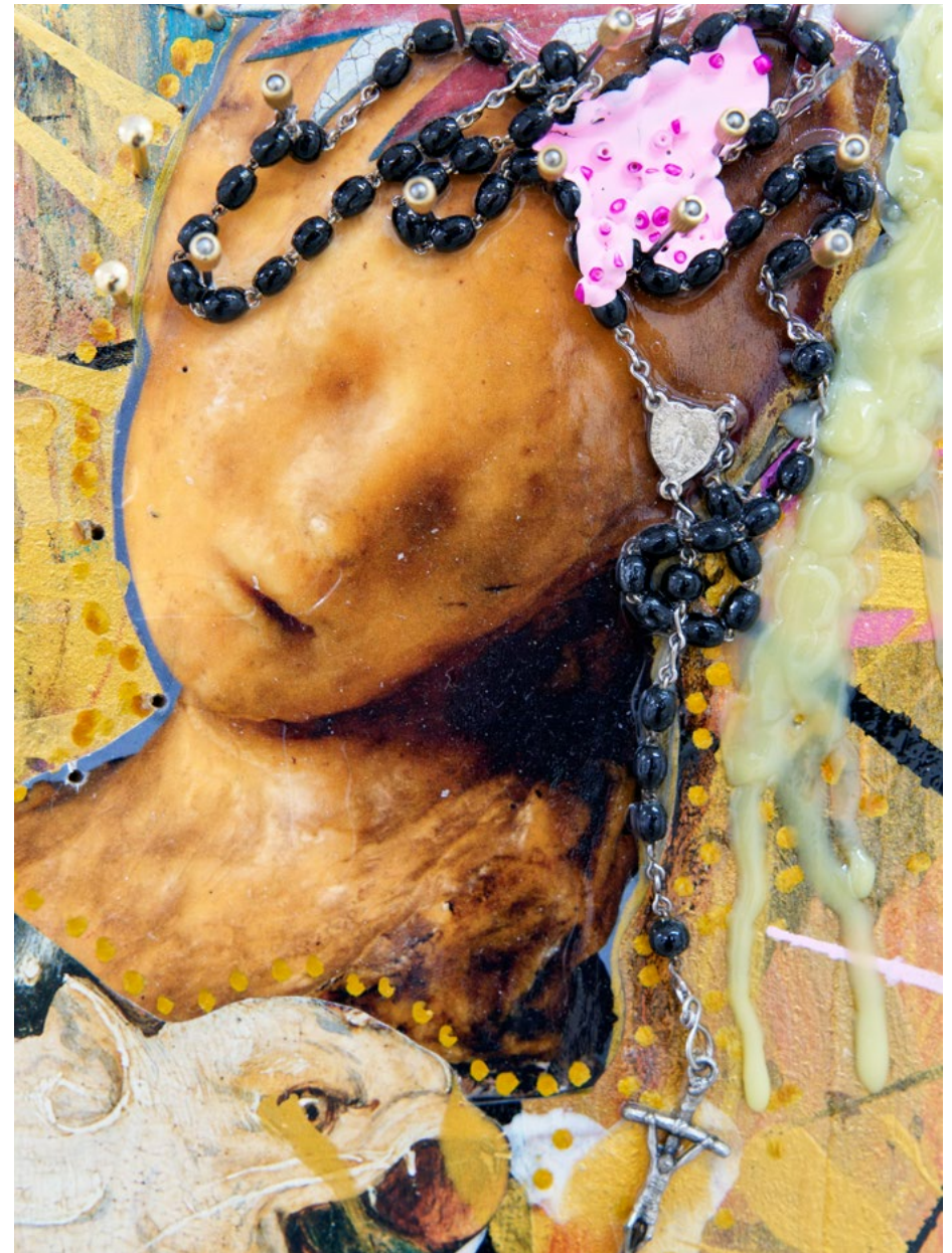
Sans titre (détail), 2024, technique mixte sur bois, 44 x 34 cm