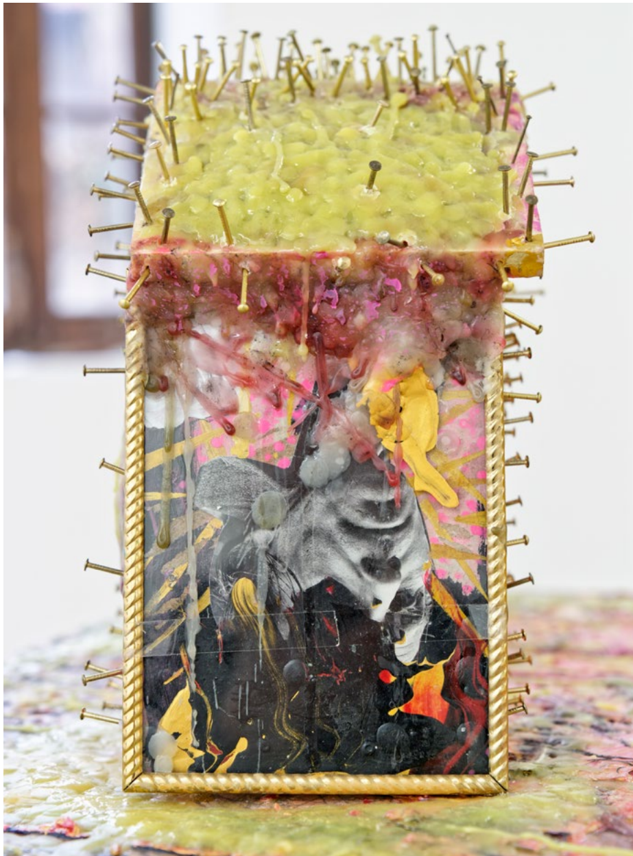
Sans titre, 2024, technique mixte sur bois, cabane de mésanges, 100 × 53 × 67 cm