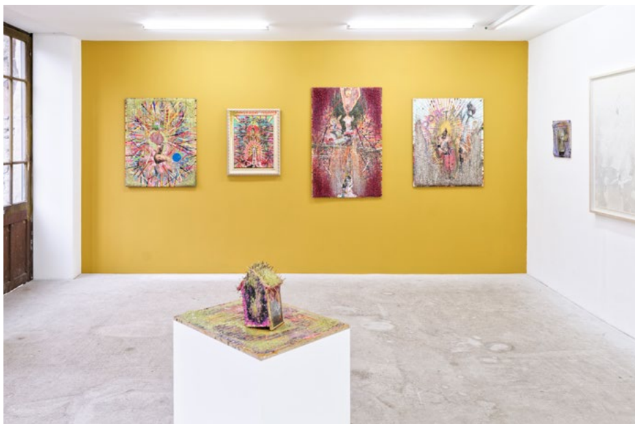
Vue de l'exposition Past Increasing de Jan R. Faust, à L'Assaut de la menuiserie