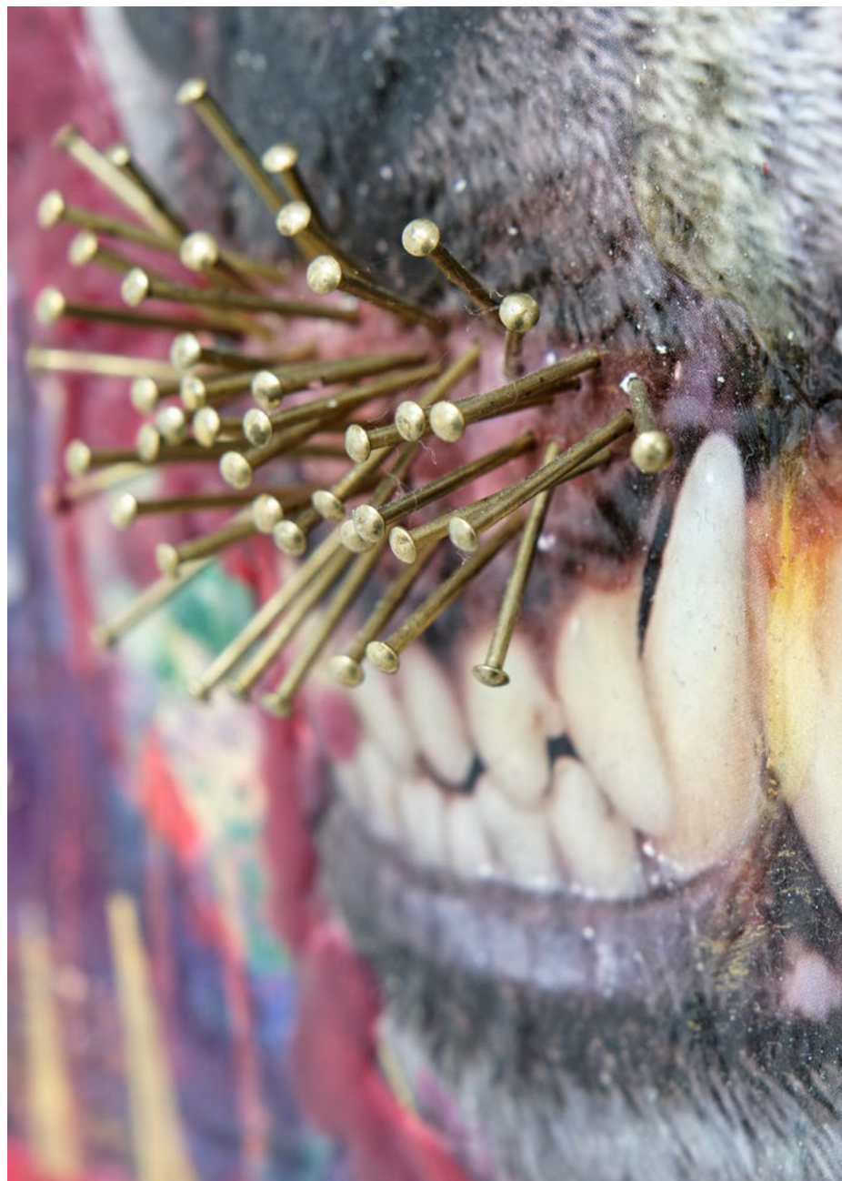
Jan R. Faust, Sans titre (détail), 2024