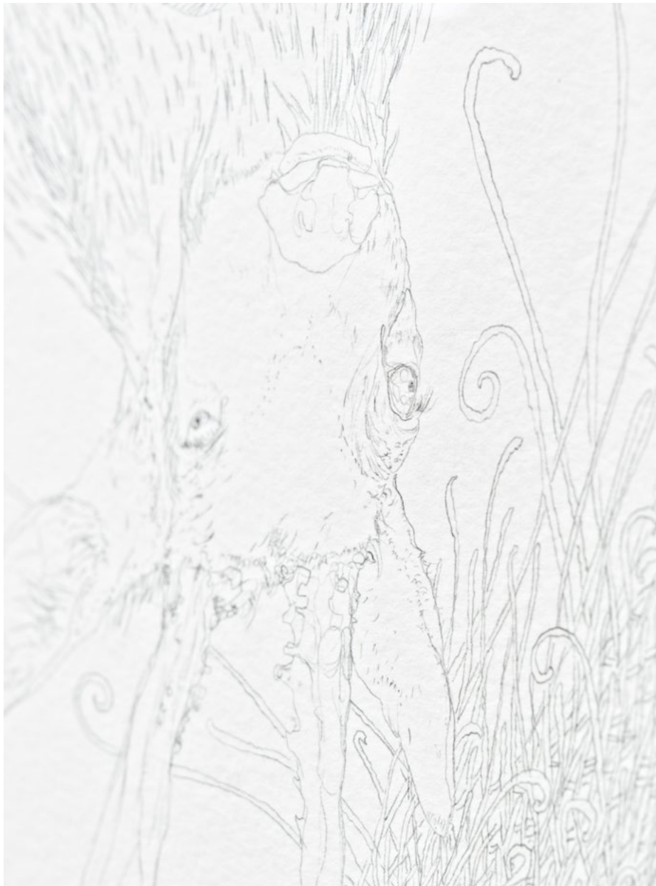
Sans titre (détail), 2017, graphite sur papier, 118 × 88 cm (encadré)

une exubérance onirique. Jan R. Faust déclare trouver une influence dans les œuvres obsessionnelles de Marcel Storr et d'Augustin Lesage, figures emblématiques de l'art brut. Motifs en spirale, bêtes décapitées, crânes, organes et cordons ombilicaux distendus relient des formes et des jurons en allemand, français et anglais. Des chimères anthropomorphes croisent des figures animales et végétales, puisées dans l'imaginaire des forêts d'Europe centrale et d'Australie, qu'il a capturées à travers son objectif pendant de nombreuses années.