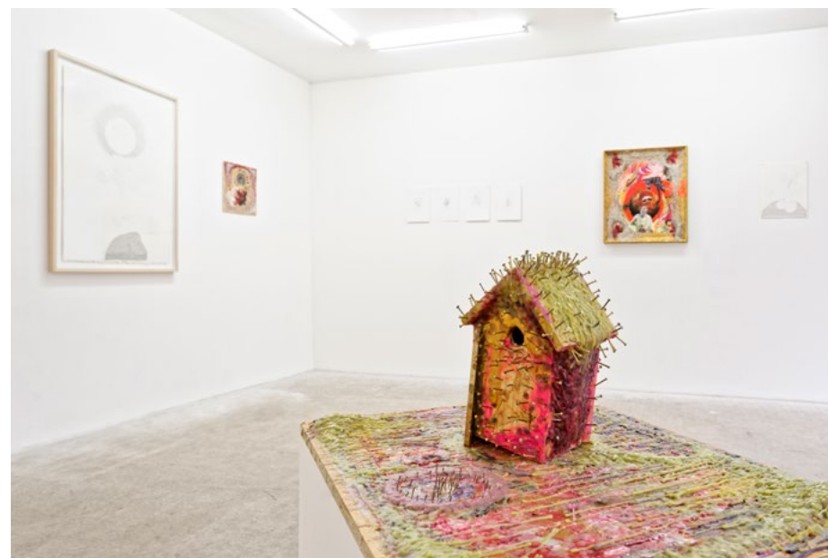
Vues de l'exposition Past Increasing de Jan R. Faust, à L'Assaut de la menuiserie