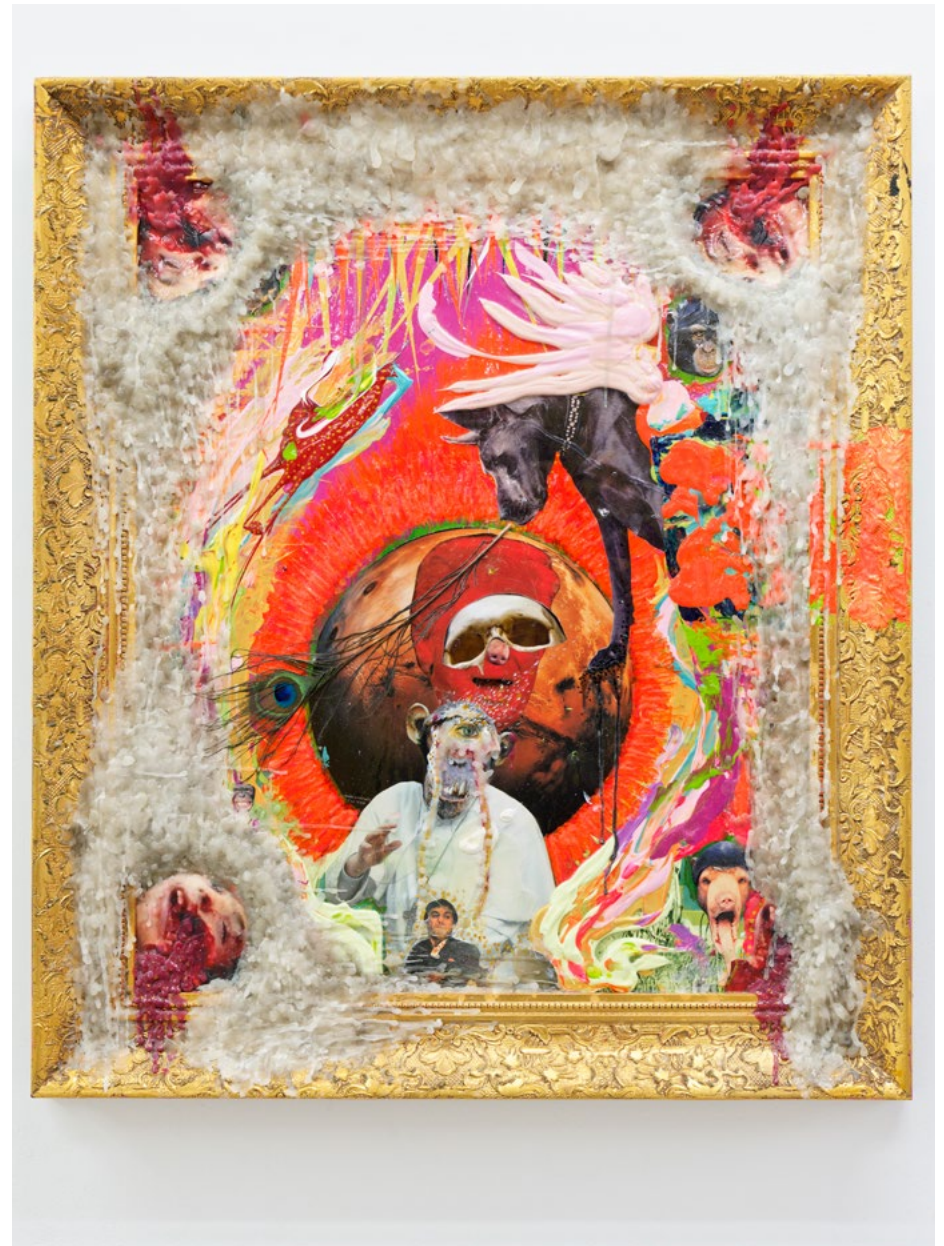
Sans titre , 2017-2024, technique mixte sur bois. 72×63 cm