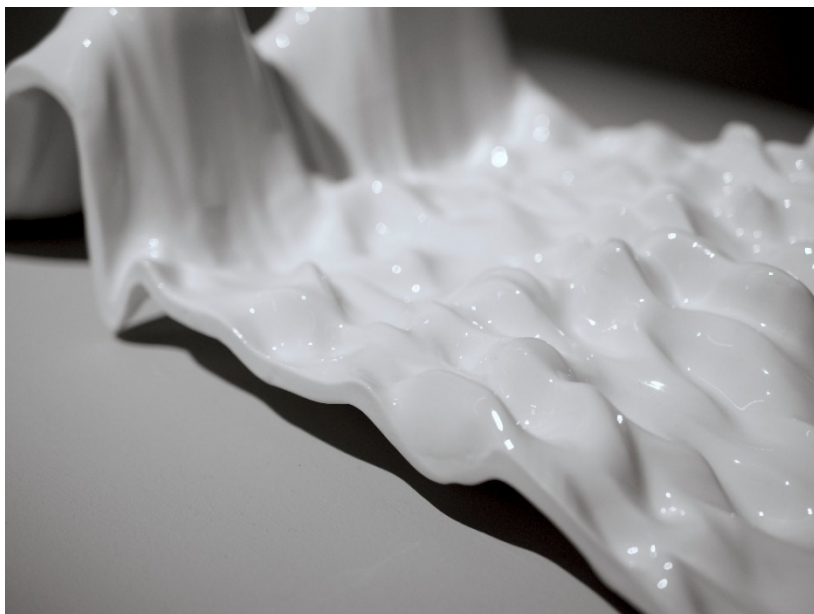
Fabien Zocco, La Parole Gelée , 2023 © photo : F. Zocco, Collection Frac-Artothèque Nouvelle-Aquitaine

Exposition collective avec : Fabien Zocco, Momoko Seto, Florent Meng Lechevallier, Kiti Kurarova, Minjung Kim, Rémy Jacquier, Jeanne Gort, Ludovic Bernhardt