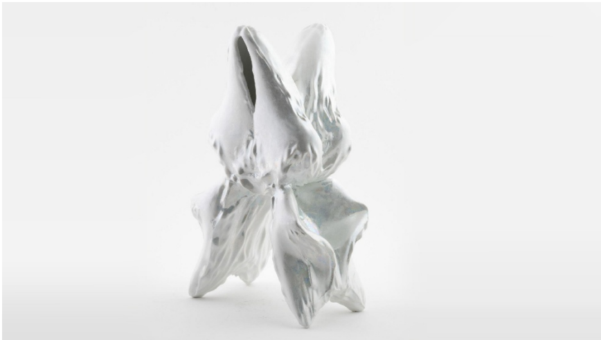
Kiti Kurarova, EFDA.IRIS , 2024, © photo : Kiti Kurarova

Cette œuvre en porcelaine fait partie d'une famille d'objets qui évoquent des spécimens naturels inconnus et qui constituent ensemble un système d'"êtres vivants", car ils ont tous été créés à partir d'une graine (sphère) numérique dans un logiciel 3D. Par une manipulation digitale qui permet de transformer constamment la forme comme une pâte à modeler, l'artiste joue d'une grande symétrie pour instaurer une perfection dérangeante. Ainsi ce passage par la création digitale lui permet d'inventer des formes hybrides à l'esthétique organique qui attisent la curiosité tout en gardant un sentiment d'inquiétant étrangeté.