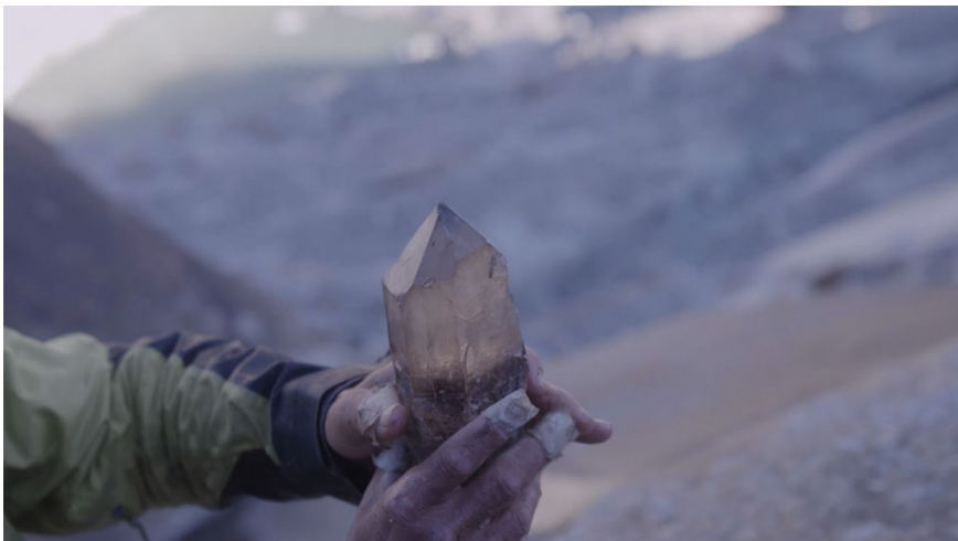
Florent Meng Lechevallier, The Analogue Tracks , 2024

Construit comme une quête, The Analogue Tracks interroge le langage minéral, dernière frontière du langage, telle que pensée par l'autrice de science-fiction Ursula K. Le Guin dans sa nouvelle The Author of the Acacia Seeds (1974). Le film prend pour point de départ le prélèvement d'un quartz dans le massif du Mont-Blanc et s'engage dans une exploration ouverte et expérimentale de possibles « traductions » de cette matière, à la recherche d'un langage que l'artiste nomme « pétrologuistique » – une forme de langage propre à la pierre. Construit comme le journal d'un quartz, The Analogue Tracks questionne nos capacités à entrer en relation avec le non-vivant.