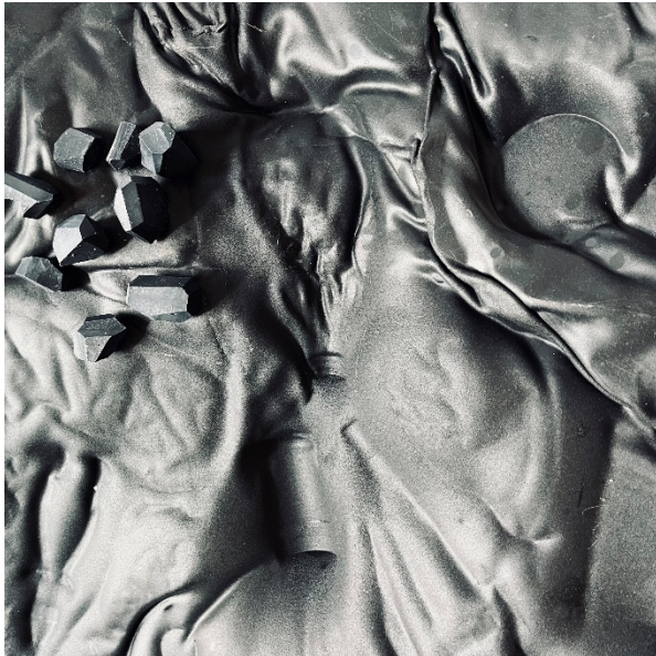
Matériaux utilisés par le duo Not a Number, 2024