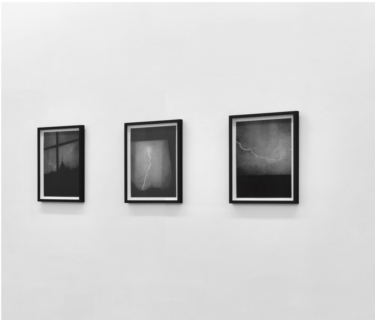
© Célia Muller, Invocations (série), vue d'exposition à la galerie Maïa Muller, 2023