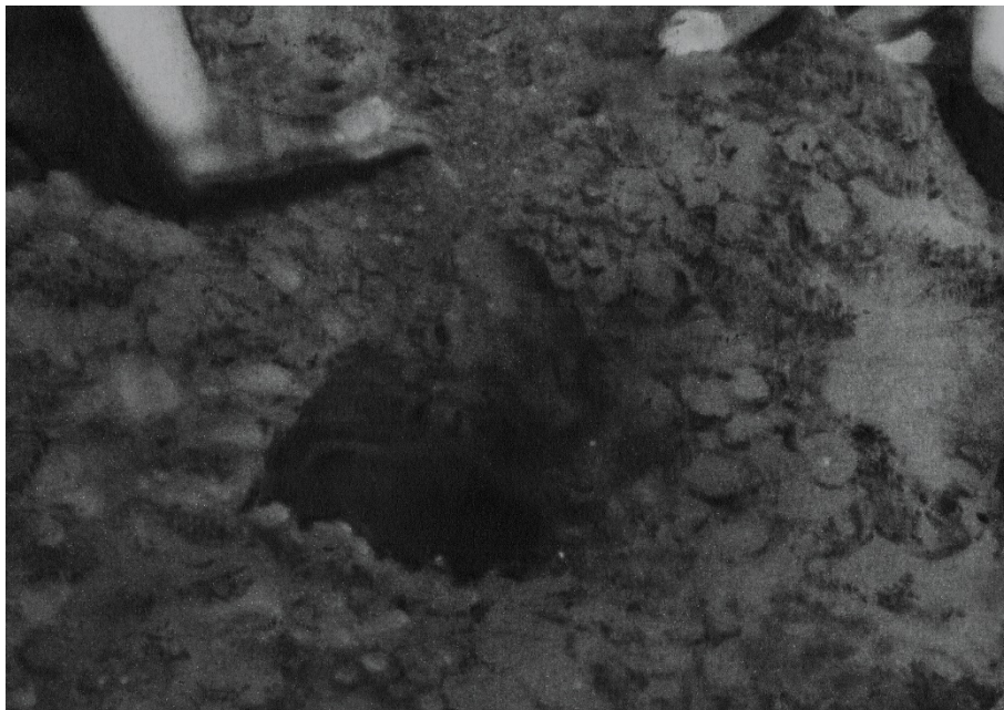
© Célia Muller, L'amour et la rage (détail), 2023