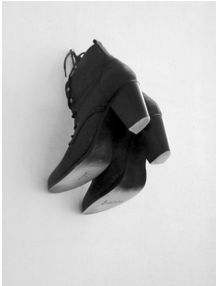
© Célia Muller, Je passe , 2023