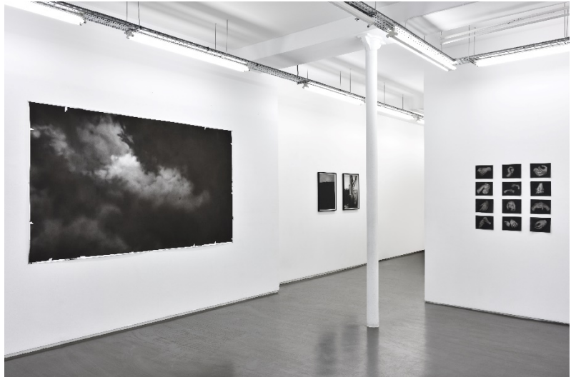
© Célia Muller, vue d'exposition à la galerie Maïa Muller, 2023